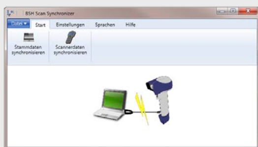
Benutzeroberfläche von BSH Scan Synchronizer