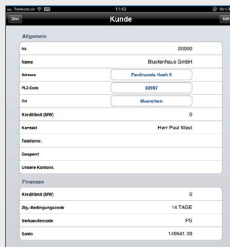
Anzeige eines Kontakts auf dem iPad